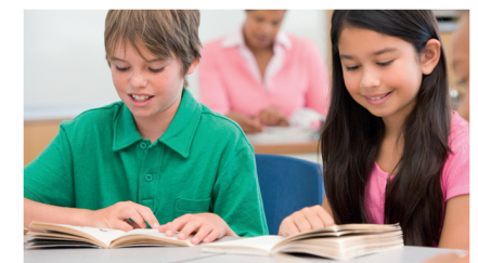
Freude am Lernen